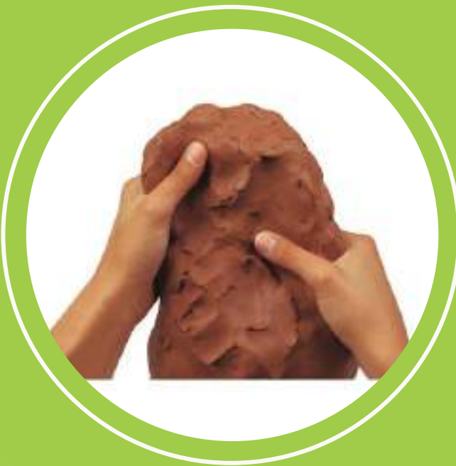
experimentació amb fang