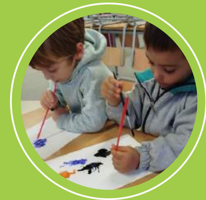
experimentació amb pintura