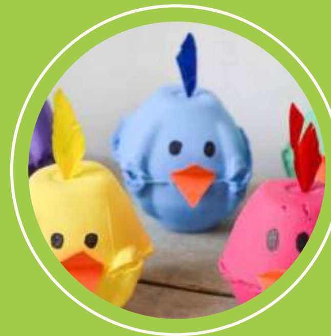
treball amb material reciclat