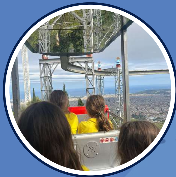
excursió al Tibidabo