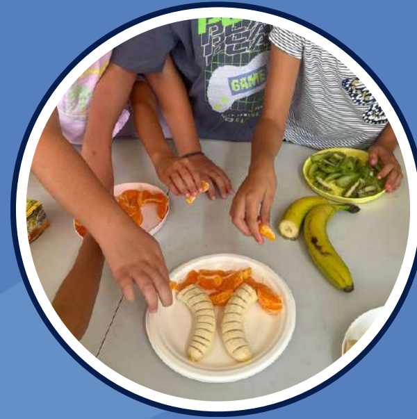
activitats i tallers