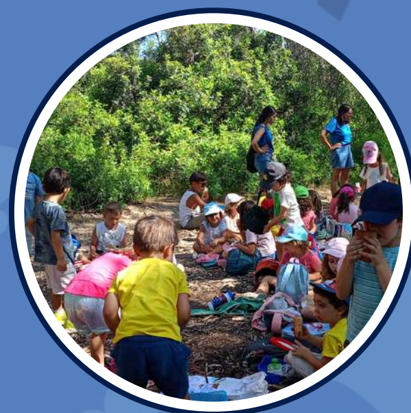
sortides per l'entorn