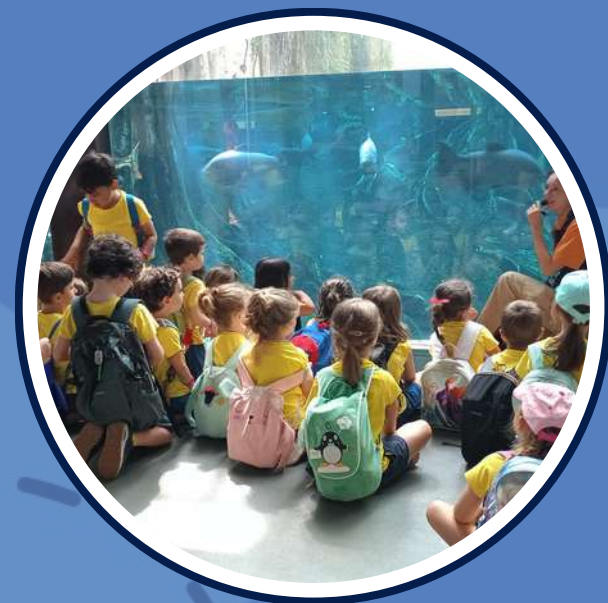
excursió al CosmoCaixa