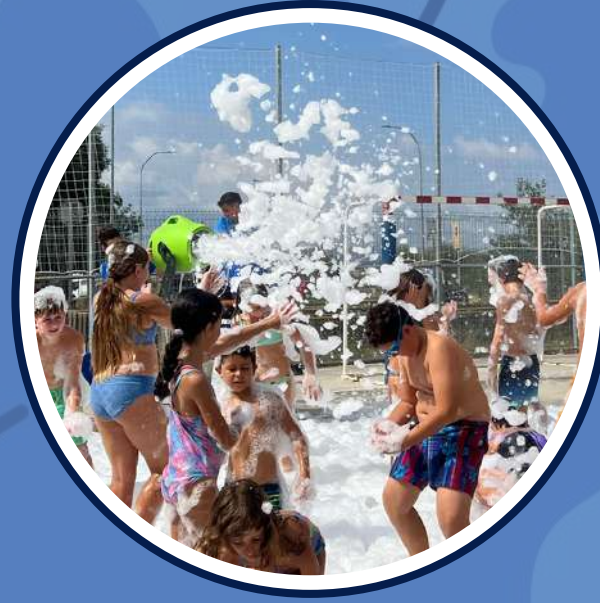
festa de l'escuma