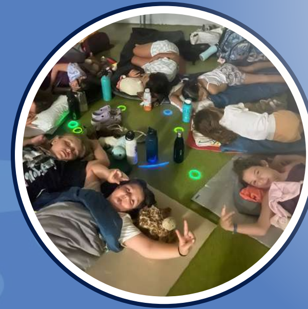
Nit al casal